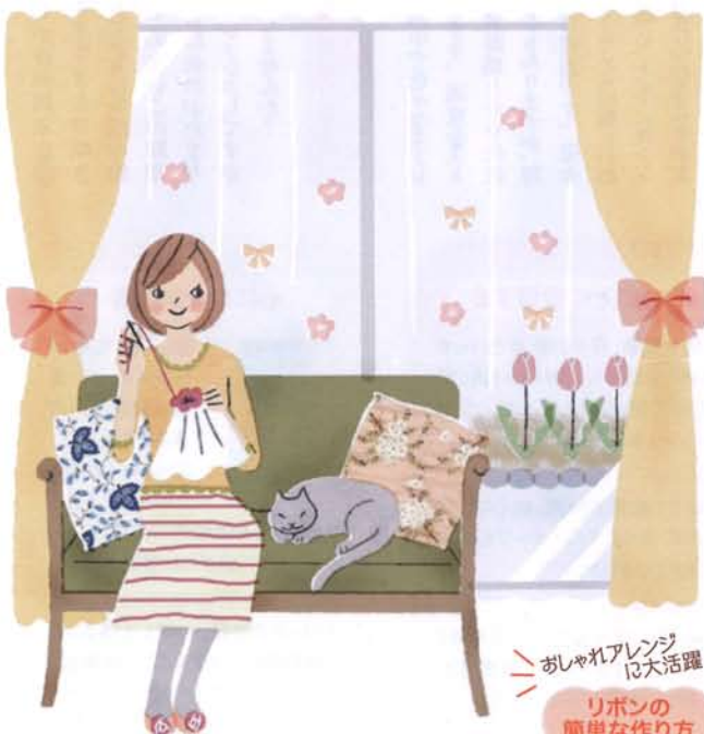
おしゃれアレンジは大活躍 リボンの簡単な作り方